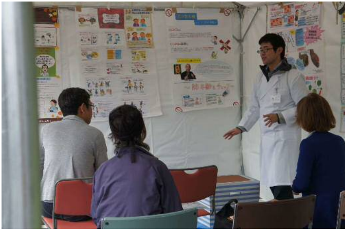
検査を行う前に、今からどのような検査を行って、何が分かるのかを説明しました。