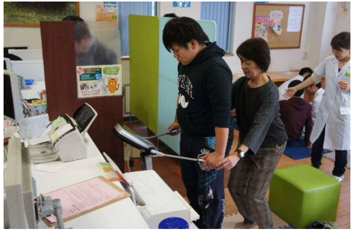
肥満が気になる方には今年も大人気の体組成計。

検査を終えた方には、薬剤師、管理栄養士、登録販売者、中医師が相談・指導を行います。