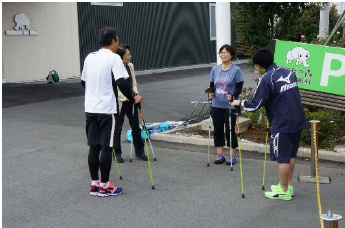
運動部門ではポールウォーキング体験を行いました。