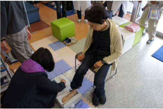
骨密度では低い方が続出！！ ん～ なぜだろう？